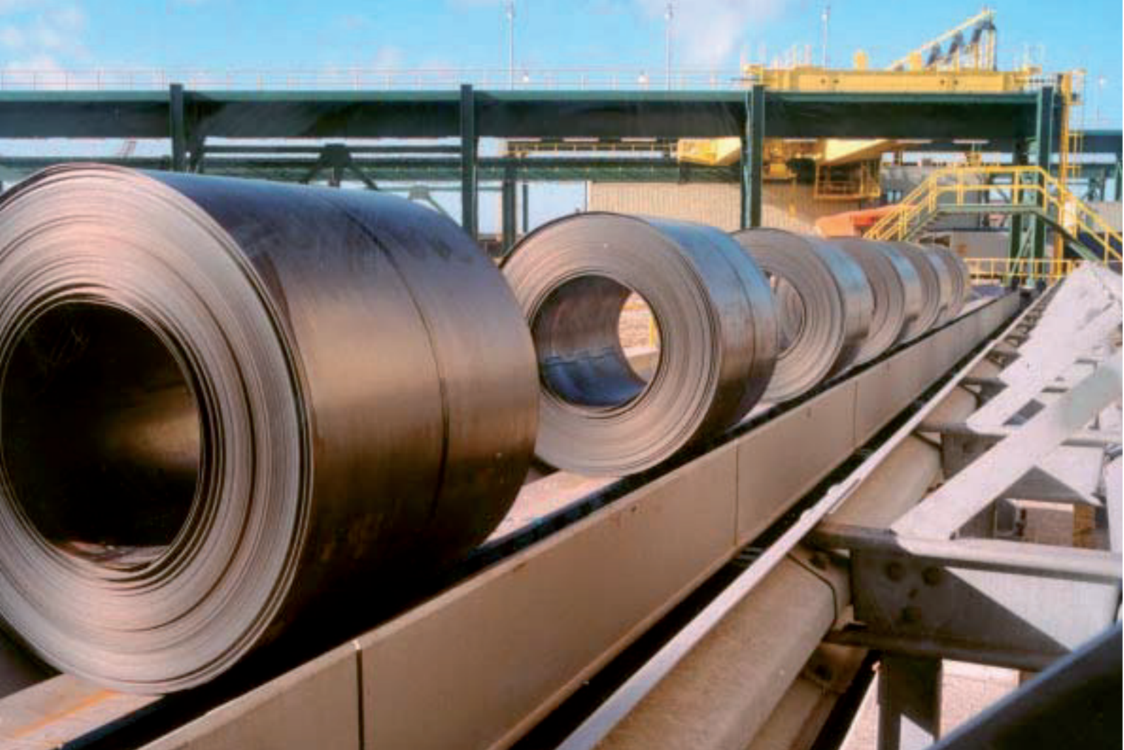
Figuur 3 - Thermomechanisch gewalste rollen bij Corus IJmuiden uit de Direct Sheet plant (DSP). Deze plant produceert per jaar circa 1,2 miljoen ton hoge sterktestaal, waaronder S550MC (Ympress)