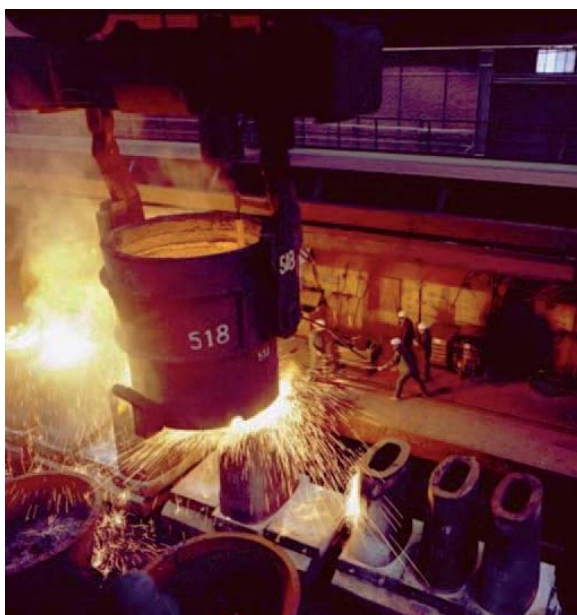
Het blokieten in vroegere tijden

Bij het stollen van gekalmeerd* staal hebben verontreinigingen de neiging voor het stolfront uit gestuwd te worden. Er ontstaat een zogeheten segregatie in het laatst stollende metaal. Dit betekent dat de samenstelling over het blok niet overal gelijk is. De bodem waar de stolling begint is zuiver, terwijl de bovenkant van het blok - wat als laatste stolt - veel meer verontreinigingen bevat. Daarnaast heeft de bovenkant ook een grote slinkholte. Deze kop, ongeveer twintig procent van het totale blok, moet worden verwijderd en als productieverlies worden beschouwd. Dit afval wordt als schroot opnieuw gebruikt bij de staalbereiding. Bij het gieten en stollen van ongekalmeerd* staal zal